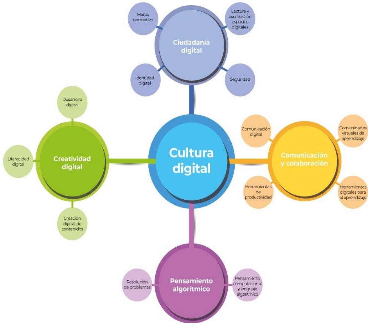
Figura 1. Categorías y subcategorías de Cultura digital